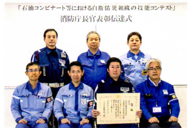
「石油コンビナート等における自衛防災組織の技能コンテスト」 消防庁長官表彰伝達式

今年度は全国の管轄消防本部から推薦された42組織が出場し、大型化学高所放水車および泡原液搬送車または高所放水車および化学消防車を使用した競技が行われ、審査の結果、20組織が表彰されました。