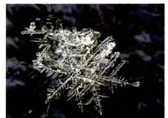
▲結晶「樹枝六花」