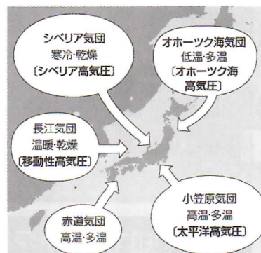
▲日本付近の気団のイメージ図

「オホーツク海気団」から吹き出す低温・多湿の北東気流、「小笠原気団」の周囲を巡る高温・多湿の南西気流とがぶつかる帯が「梅雨前線」です。この周辺では、たびたび低気圧が発生し集中豪雨が起りやすくなります。