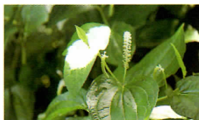
▲半夏生の語源となった「半夏」。葉の半分が白くなる葉草の一種。

梅雨は日本列島だけでなく、東南アジア全体におよぶ循環(風系)の一部で、日本の梅雨は、右上図にあ