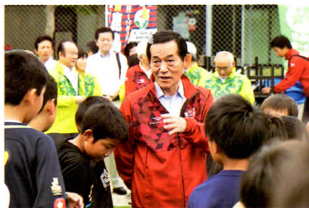
▲茨城国体鹿嶋市開催100日前イベントで、子どもたちにも想いを伝えました。

日々、「まちづくりは人づくり」という考えのもと、鹿嶋っ子が郷土に愛着を持てるような「教育力」の充実を図っています。そして、子どもたちが、身近にある悠久の歴史・文化、整ったスポーツ環境に誇りを持ち、恵まれた環境の中で人間形成ができるよう取り組んでいます。